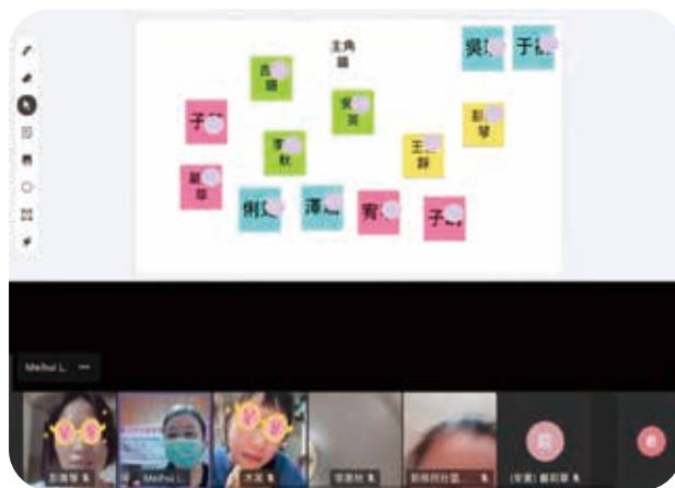
9/4臺北市北區新移民社區關懷據點辦理繪本屋「好好照顧我的花」線上課程。