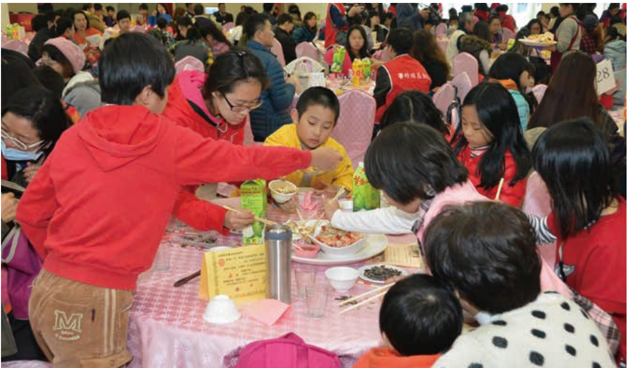
賽珍珠家庭齊聚一堂，共享溫馨圍爐。