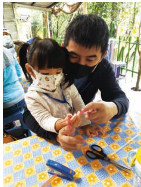
親子共同手作、其樂融融