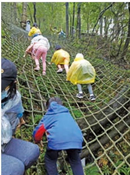
透過讓孩子獨立完成攀爬，看見他們不同的能力

中心與當地社區資源結合辦理活動，也讓親子能在防疫時期，經由活動參與，增進良好親子互動及舒緩身心壓力的機會。成員許多的第一次，也是中心的第一次，更是服務區域民眾與中心第一次的回憶，期盼後續的活動，能再見到成員們相互支持、互助的感動，以及用不同角度，見到孩子的獨特性。