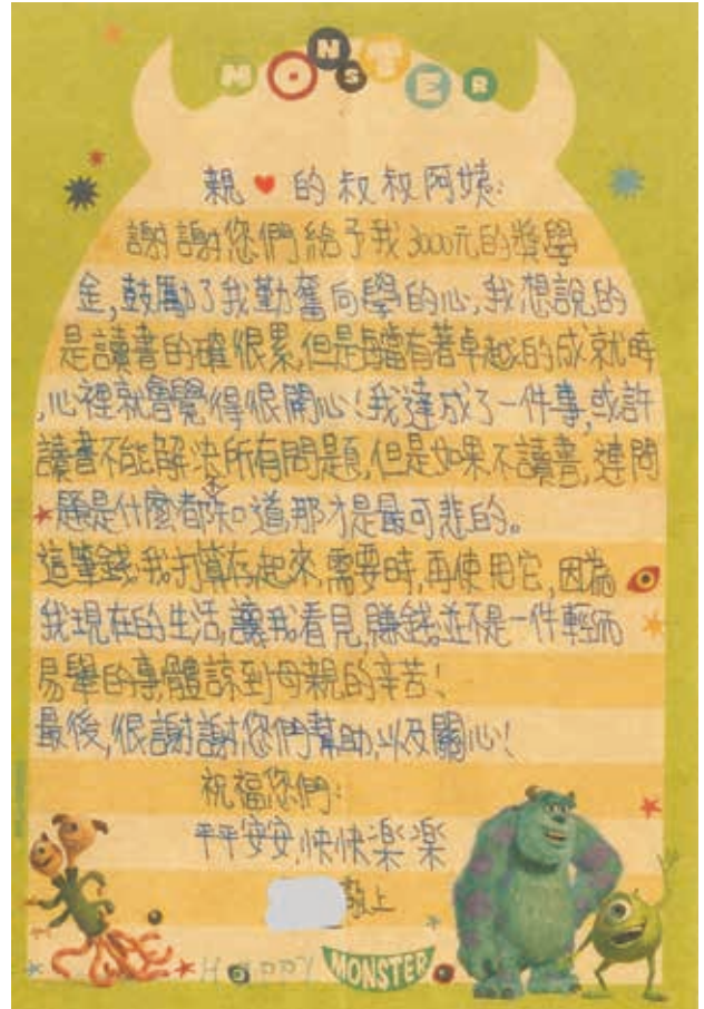
孩子寫信給贊助獎助學金的叔叔、阿姨們，謝謝大家的關懷和支持。

收穫，增進其信心與成就感，也能從中提供孩子更實質的服務，讓孩子有機會運用一筆獎金，替自己規劃未來學習方向，無論是買教科書、文具或甚補習，都讓孩子學習到替自己的未來規劃，也能讓孩子學習自我管理。