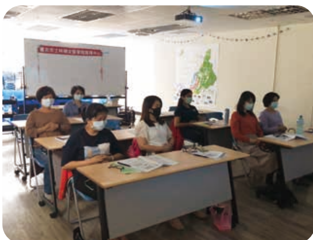
10/30士林婦女中心辦理睡睡平安講座，成員們練習睡眠的治療方式-放鬆訓練。