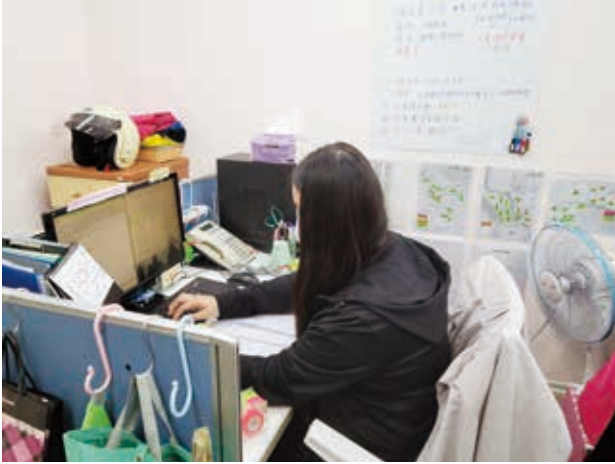
社工正在整理訪視資料作為規劃服務計畫的參考。

我很期待第一次家訪，因為是第一次，我總想著：有可能會遇到人嗎？會遇到怎麼樣的人？或者遇到人了，但是對方不願意和我當面談，怎麼辦呢…等等，很多這類的想法常常在我腦中盤旋。還會安慰自己：如果沒有訪到人，也不要失望，只是離要訪到第一個人的時間往後延了。也會想，如果我訪到人了，我要怎麼做？我可以順利地向對方詳細或者簡單地講出母會和據點的介紹嗎？或者對方問了我什麼問題，我沒辦法回答或者回答不夠好呢…等等，很多很多情況都在訪視前，我已先和自己預演過一遍又一遍。