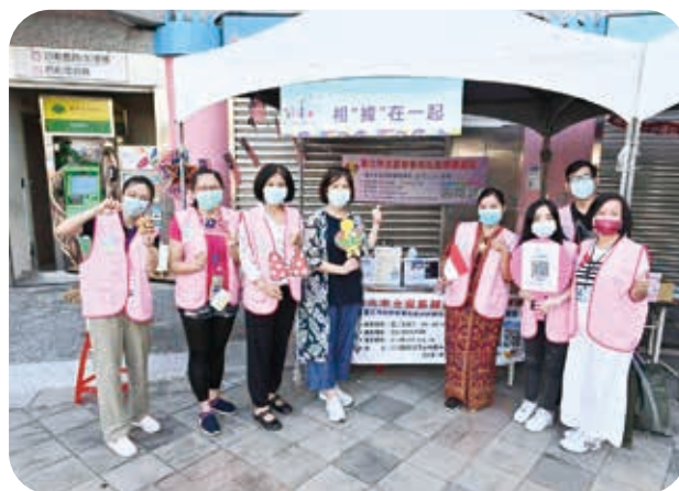
10/24臺北市北區新移民社區關懷據點於士林國際文化節設攤。