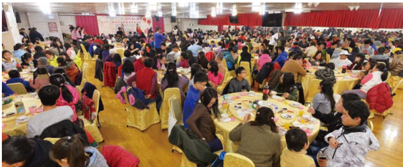
隨著會務擴展，現在平均每年約700人一起圍爐。

因為疫情，孩子們難免會擔心地問社工說：「老師，我們今年還辦圍爐嗎？」社工說：「會的。」是的，不論今年還是後面有多少年，我們都希望維持這美好的年節活動，也希望大家能繼續和我們一起把這個活動辦下去，讓我們彼此都能在愛與溫暖中互道聲：新年快樂!!並知道它不是虛應故事，而是一個正在實現的美夢。