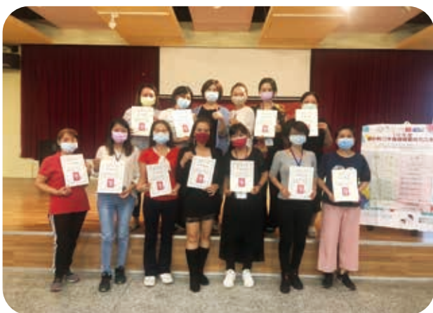
9/26「愛的剪刀手-基礎美髮培力工作坊」成果發表會。