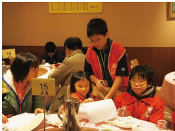
有的孩子長大後也會擔任活動志工，一起服務大家。